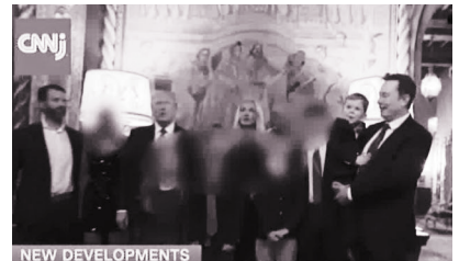
トランプ氏がフロリダ州バームビーチに所有する自宅兼リゾート施設「マールアラゴ」で、トランプ氏家族と親しくするマスク氏(右)

スウィッシャー そうですね、思うに問題は、非常にナルシシスティックで、ボスであることが好きな2人がいて、(映画『ハイランダー』の(キャッチコピーの)ように「生き残るのはただ一人」というような状況があっ